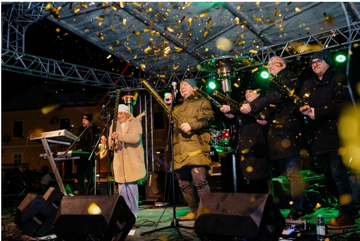
Izviješće o radu Gradonačelnika za razdoblje srpanj – prosinac 2025. godine